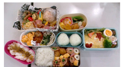
1年生が自分でつくったお弁当です。

1月31日(水)、1・2年生は第2回「自分でつくる弁当の日」でした。(3年生は筑後地区私立高校入試)2001年、香川県たきのみやしょうがっこうから始まった取組です。食事は体をつくるだけでなく、心も育むもの。前日から、朝早くから、お子様が奮闘していた姿を見守ってくださり、ありがとうございました。「自分のために、誰かのために 食事を作るのは楽しい」そんな生徒たちが育っています。