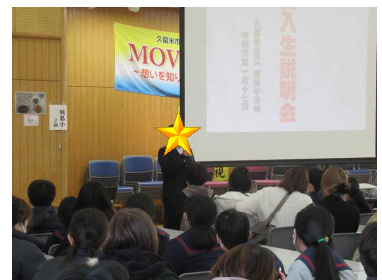
小学校6年生への歓迎の言葉

小学校6年生・保護者の皆様が、安心して来年度ご入学されることを、在校生・職員一同心よりお待ちしております。