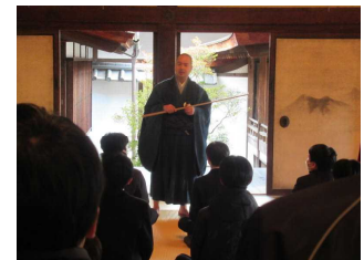
座禅で心を整えています