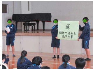
実行委員長のスローガン発表

5月8日（月）には、体育大会の結団式を行いました。実行委員長からスローガン発表が行われ、各ブロック長・副ブロック長の紹介が行われました。以下、実行委員長と各ブロック長の抱負です。