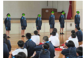
ブロック長・副ブロック長の紹介