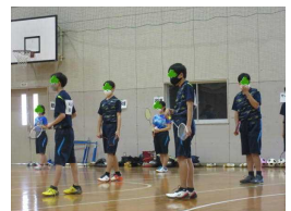
部活動紹介の様子

4月12日(水)には、新入生歓迎行事「生徒会組織説明」と「部活動紹介」を行いました。また、4月21日(金)には、生徒総会を行いました。生徒会活動は「自分たちができることで、学級や学校におけるより良い生活づくりに参加し、仲間とともに自分たちの力で安心・安全な学校をつくる」活動です。そして生徒総会は、その活動の1年間の在り方を確認する場です。今年のスローガンは「輝～個性で染める城 中の華」このスローガンは、今後の体育大会・文化発表会にも通じるものです。生徒会本部役員や各常任委員長・副委員長のみんながしっかりと「根」となり、仲間としてクラス・ブロックのみんなと支え合い(「茎・葉」)、城 中生一人一人の個性が「花(華)」開き、良い「実」を結ぶことを願っています。