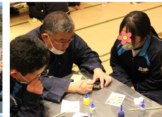
加飾(絵付け)の体験中