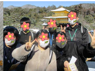
背景の金閣寺は、雪化粧