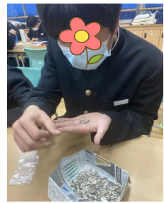
ひまわりの種を地域へ