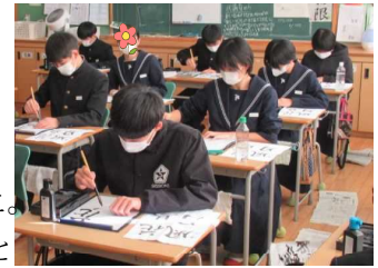
凛とした空気漂う3年生教室

1年「大木」、2年「雲海」、3年「花鳥風月」の課題に挑戦しました。静まりかえった教室に、墨汁の香りが立ちこめます。落ち着いた態度と真剣な表情の生徒たち。令和5年の活躍が楽しみです。