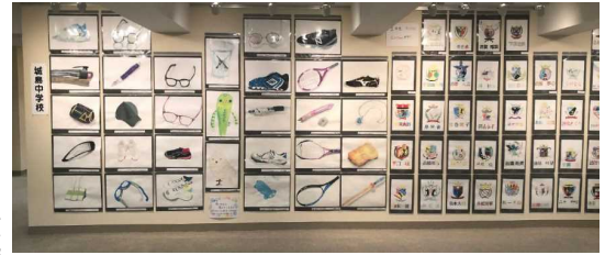
2年「エンブレムのデザイン」など

1月19日(木)～27日(金)、久留米市美術館にて久留米市中学校美術作品展が開催されました。 本校のブースには、3年「和菓子のデザイン」・1年「身近な物を本物そっくりに表す」など、授業で作成した才能あふれる作品が展示されていました。