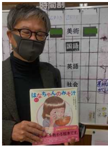
はなちゃんのみそ汁