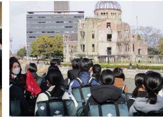
原爆ドームについての説明