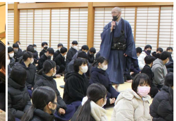
座禅で心を整えています