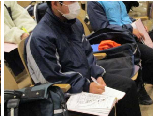
講話中には、しっかりとメモ