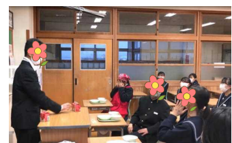
劇中、給食の時間の様子